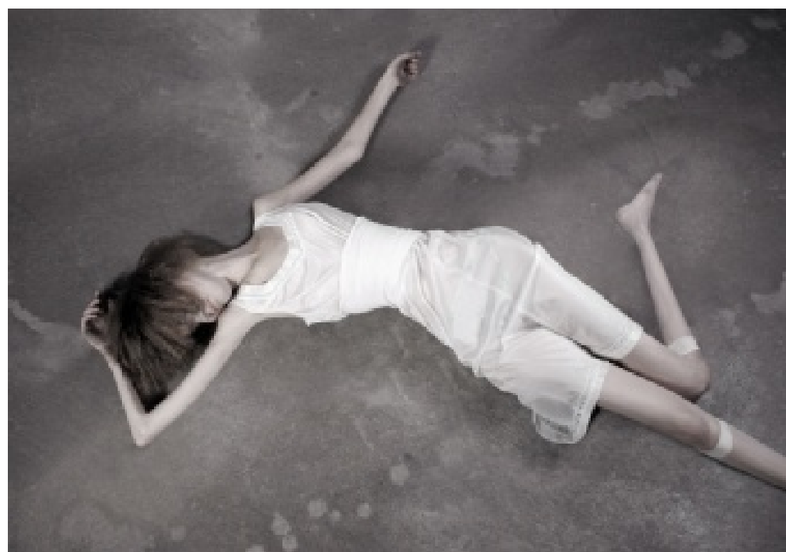
► Imagen de la serie "Thirty-Two Kilos"

Aprecio la obra de Erwin Olaf como fotógrafo contemporáneo. Me gusta su estilo único y la mezcla visual de fotografía comercial y trabajo de autor. Sus exageraciones son algunas veces subestimadas. Otro fotógrafo contemporáneo que aprecio es Terry Richardson, por su punto de vista directo y la manera en que nos aproxima a sus modelos. Y entre los fotógrafos del pasado, me impresionó la obra de Diane Arbus, el interés en la otredad de sus modelos y la sensibilidad de sus fotografías.